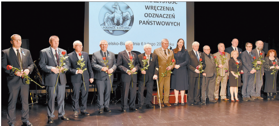
Pamiątkowe zdjęcie osób odznaczonych 6 lutego w Bielsku-Białej prezydentkami Medalami Stulecia Odzyskanej Niepodległości.

Członkowie podbeskidzkiej „Solidarności”, a wraz z nią znamienici goście, oddali hołd uczestnikom strajku generalnego z 1981 roku. Główne uroczystości odbyły się 6 lutego, dokładnie w 39. rocznicę podpisania porozumienia, kończącego tamten protest.