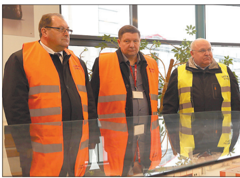
Minister Wiesław Łyszczek (pierwszy z lewej) podczas zwiedzania żywieckiego browaru.

W czwartek 6 lutego na Podbeskidziu przebywał Główny Inspektor Pracy minister Wiesław Łyszczek. Głównym celem jego wizyty był udział w uroczystościach, związanych z 39. rocznicą zakończenia strajku generalnego „Solidarność”. Przy okazji minister odwiedził także Arcyksiążęcy Browar w Żywcu, korzystając z zaproszenia Międzyzakładowej Organizacji Związkowej NSZZ „Solidarność” Grupy Żywiec SA. Miał okazję zapoznać się z warunkami pracy w tym jednym z największych w Europie i najbardziej nowoczesnych browarów. Chwalił obowiązujące w tym zakładzie procedury i dobre praktyki, które zaowocowały zwycięstwem żywieckiego browaru w dziesiątej edycji konkursu „Pracodawca Przyja-