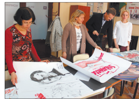
Jurorzy podczas oceniania prac nadesłanych na II Regionalny Konkurs Plastyczny.