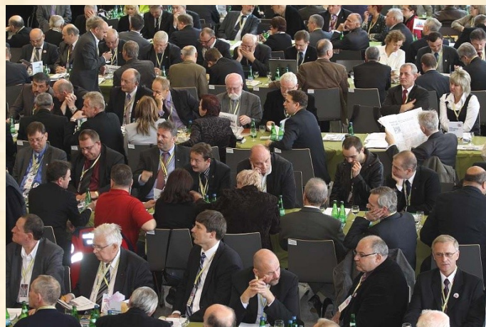
Krajowy Zjazd Delegatów przyjął uchwałę programową. Delegaci za najważniejsze uznali upominanie się o godną i bezpieczną pracę dla wszystkich oraz budowę silnego i skutecznego Związku.