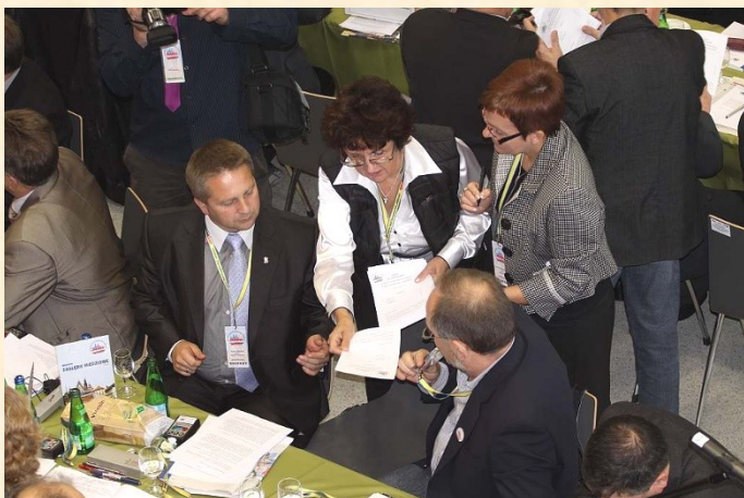
Wybory Komisji Krajowej oraz Krajowej Komisji Rewizyjnej to były główne punkty ostatniego dnia 25 Krajowego Zjazdu Delegatów.