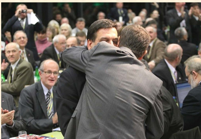
Janusz Śniadek pogratulował Piotrowi Dudzie zwycięstwa i podziękował tym, którzy głosowali na niego.