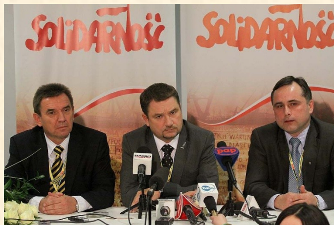
Po wyborach podczas konferencji prasowej nowy przewodniczący podziękował za poparcie i zaufanie, którym obdarzyli go delegaci. Zapewnił również, że słowa dotrzymuje i to co mówił będzie realizowane.