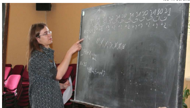
fol. W. Obremski

O tym, że NSZZ „Solidarność” powinien być stroną w procedurze zawiadywania systemem oświaty zawyrokował Naczelny Sąd Administracyjny. NSA uznał też, że decyzja prezyden-