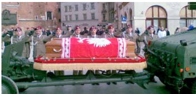
Od śmierci Lecha Kaczyńskiego mijają 4 lata, ale przyczyny tragedii nadal budzą wątpliwości